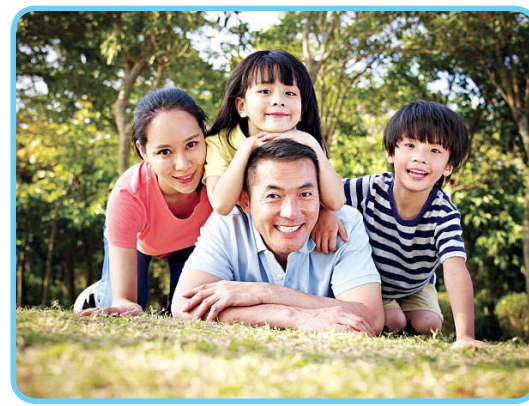
รูปที่ 1.1 ครอบครัว

ความสำคัญของครอบครัว ครอบครัวเป็นสถาบันพื้นฐานในการอบรมเลี้ยงดู ให้การศึกษา ถ่ายทอด และเสริมสร้างประสบการณ์ต่าง ๆ ให้แก่สมาชิกในครอบครัว ตั้งแต่เยาว์วัยไปจนถึงเติบโตเป็นผู้ใหญ่ ตลอดจนทำให้สมาชิกในครอบครัวมีบทบาทหน้าที่ในฐานะต่าง ๆ ในครอบครัว หรือมีบทบาทภาระหน้าที่ในฐานะสมาชิกของชุมชนหรือสังคมนั้น ๆ