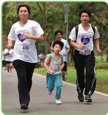
รูปที่ 1.4 ทำกิจกรรมร่วมกันในครอบครัว (ที่มา : https://qrqo.page.link/6YdTG )

8. มีความกตัญญูต่อบุคคล ต่อพ่อแม่และญาติผู้ใหญ่ โดยการดูแลท่านเมื่อยามเจ็บป่วย ส่งเสริมเรื่องการรับประทานอาหารที่ดีต่อสุขภาพ ชักชวนท่านทำกิจกรรมต่าง ๆ ที่เป็นประโยชน์ต่อสุขภาพกายและสุขภาพจิต ตลอดจนดูแลท่านในวัยชรา