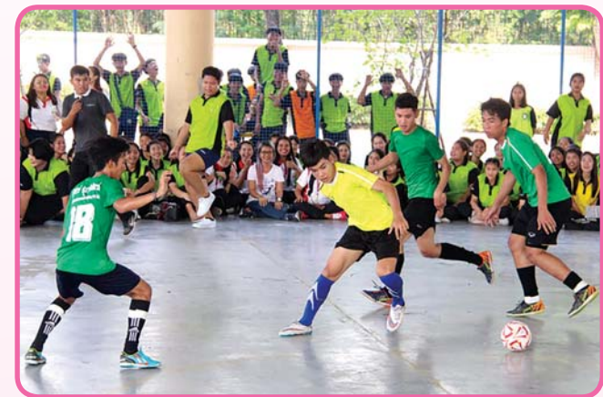
รูปที่ 1.5 เข้าร่วมกิจกรรมส่งเสริมหลักสูตร (ที่มา : https://qrqo.page.link/ectsF )

4. เข้าร่วมกิจกรรมส่งเสริมหลักสูตร กิจกรรมเหล่านี้จะเป็นกิจกรรมที่ส่งเสริมทักษะเฉพาะทางหรือความสามารถพิเศษ เช่น การเล่นกีฬา การเล่นดนตรี การร้องเพลง การฟ้อนรำ เป็นต้น