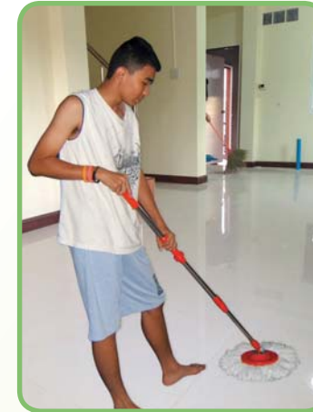
รูปที่ 1.2 ช่วยเหลืองานในบ้าน

4. รับผิดชอบงานที่ได้รับมอบหมาย การที่พ่อแม่และญาติผู้ใหญ่มอบหมายงานให้ทำก็เพื่อสอนให้รู้จักวิธีการทำงาน ให้มีความมานะ ความพยายาม รู้จักรับผิดชอบงานที่ได้รับมอบหมาย และสร้างประสบการณ์ในการทำงาน เพื่อเป็นพื้นฐานในการต่อยอดในการทำงานในอนาคต