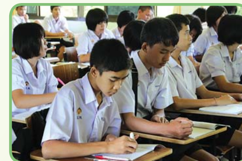
รูปที่ 1.3 ตั้งใจศึกษาเล่าเรียน

5. ตั้งใจศึกษาเล่าเรียน หน้าที่หลักของนักเรียนคือการตั้งใจศึกษาเล่าเรียนให้สำเร็จการศึกษา เพื่อที่จะนำสิ่งที่ได้เรียนมาไปประกอบอาชีพเลี้ยงตนเองและครอบครัวได้