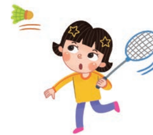
dǎ yǔmáoqiú 打羽毛球