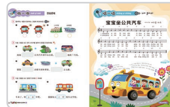
그림 보며 이야기해요! 빈칸에 들어갈 표현을 고르고, 그림을 보며 다른 사람에게 이야기를 들려주듯 말하면서 본문에서 배웠던 내용을 다시 한번 익히게 하였습니다.