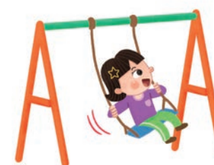
dàng qiūqiān 荡秋千