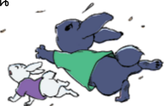
กระต่ายไม่ตื่นตูม

๕. นิทานเรื่อง กระต่ายตื่นตูม เป็นที่มาของสำนวนไทยว่า “กระต่ายตื่นตูม” ซึ่งหมายถึง คนที่ตื่นตกใจง่ายโดยไม่ใช้ความคิดพิจารณาถึงต้นสายปลายเหตุของเรื่องนั้นๆ ให้ชัดเจนเสียก่อน