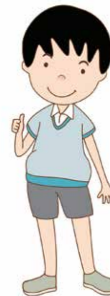
Lǐ Bō (หลี่โป)

l — a — la l — e — le l — i — li l — u — lu l — ü — lü